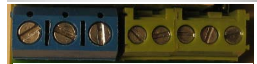
NO COM NC GND +U INC IN1 IN2